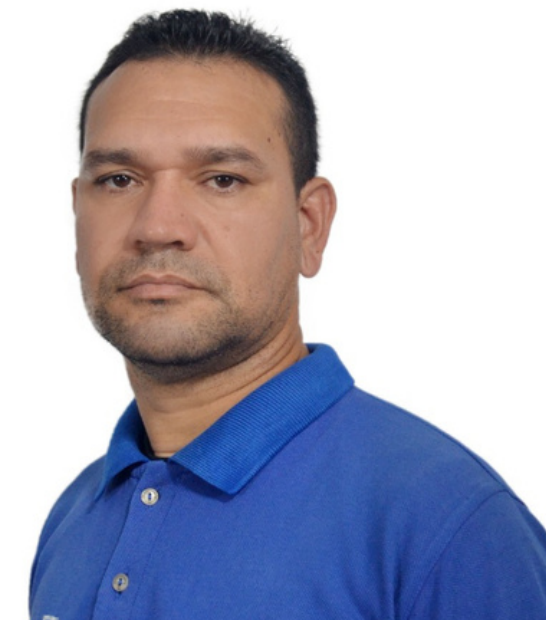
TSU. Lenin Maiz Instructor Coor.